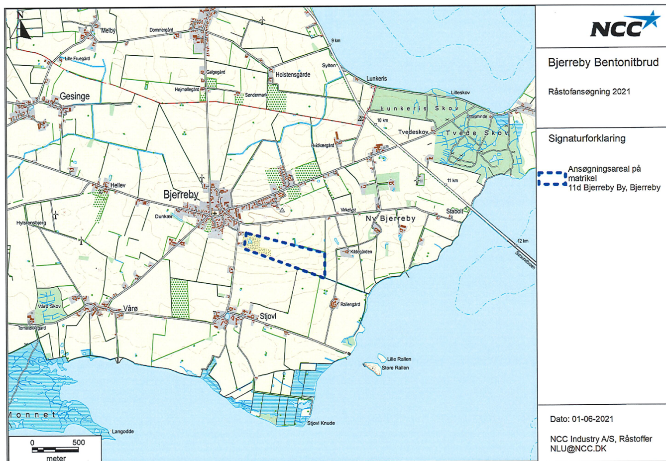
Figur 1: Oversigtskort over projektarealet.